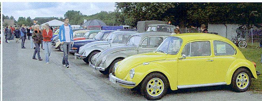
Highlight: Zu dem vom 1. Käfer-Club Celle e.V. veranstalteten Käfertreffen in Celle kommen inzwischen über 500 Teilnehmer.