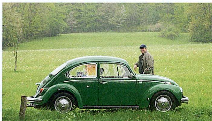
Clubgeselligkeit: Im Sommer fahren die Mitglieder des KCC traditionell in die Rhön.