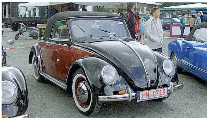
Augenweide: Beim Käfertreffen in Celle bekommen die Besucher seltene Volkswagen zu sehen.