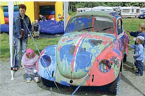
Kinder dürfen beim Käfertreffen eine Karosserie nach eigenen Vorstellungen bemalen.